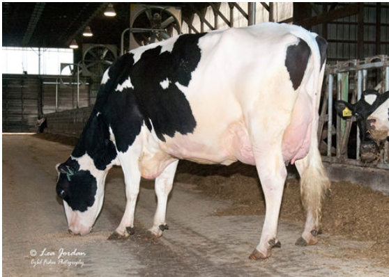
OCD DELTA 33343 FIFTH DAM