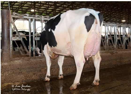
OCD DELTA 33343 FIFTH DAM